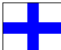
"X" Llamada individual