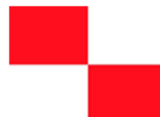
"U" Procedimiento salida