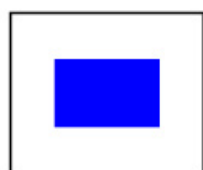
"S" Recorrido acortado