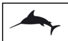
"Clase" Procedimiento salida