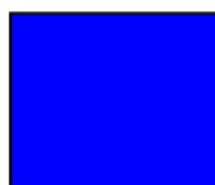
"Azul" Línea de llegada